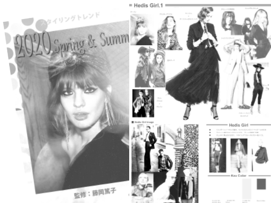
イラスト付きマップ B4カラー / 20ページ