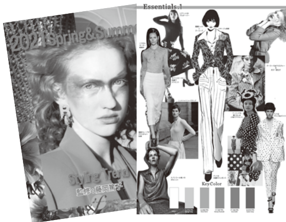
イラスト付きマップ B4カラー