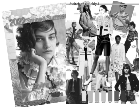
イラスト付きマップ B4 カラー