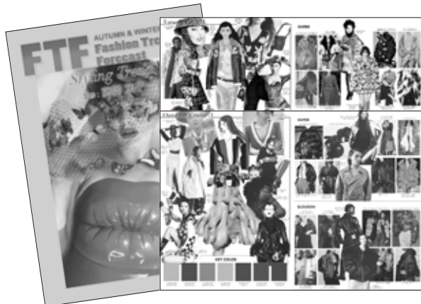
イラスト付きマップ A3カラー

※前回の配布資料見本 (A3サイズ) です。 資料の形式、内容は一部変更の可能性がございます。